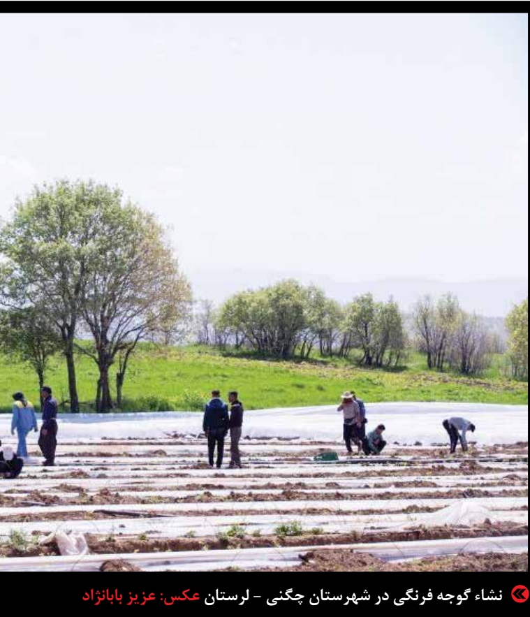
نشاء گوجه فرنگی در شهرستان چگنی – لورستان

بنابراین، این ثبات لزوماً هنر دولت یا بانک مرکزی نبود، بلکه تقاضایی وجود نداشت که قیمت را بالا ببرد. البته این نکته مثبت را نباید نادیده گرفت که نظام توانست نفت را با قیمت مناسب بفروشد و ذخیره ارزی خوبی برای مدیریت شرایط ایجاد کند. اما با شروع فعالیت‌ها، برقراری پروازها و سررسید اقساط ارزی و ریالی شرکت‌ها، تقاضا